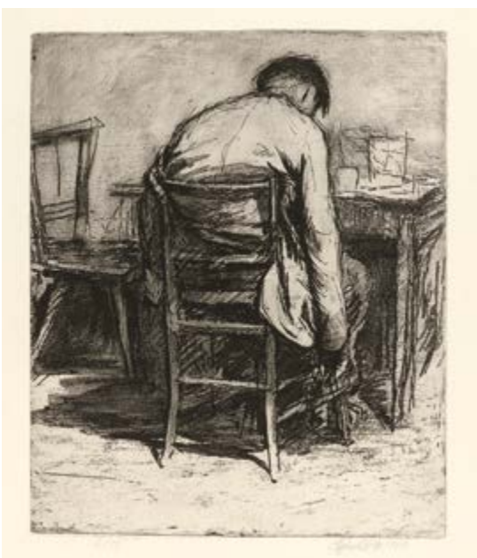
Ladislav Čepelák, Píják / Der Trinker, ze souboru Hospody / aus dem Zyklus Wirtshäuser, 1960, lep./ Radierung, 38 x 31 cm

GAVU – Výstava z depozitáře / Ausstellung aus dem Depot 8. 10. 2020–24. 1. 2021 Kurátor / Kurator Marcel Fišer