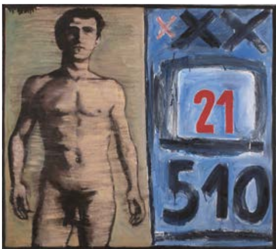
Portrét mladého muže / Porträt eines jungen Mannes, 1967, olej na plátně / Öl auf Leinwand, 130 x 145,5 cm, Východočeská galerie v Pardubicích

GAVU – Velká galerie / Grosse Galerie 10. 9. 2020–3. 1. 2021 Kurátor / Kurator Marcel Fišer Vernisáž ve středu 9. září v 17.00. Komentovaná prohlídka ve středu 16. září v 17.00. Přednáška M. Fišera o autorovi ve středu 14. října v 17.00.