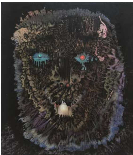
Společník / Genosse, 2017, akryl, olej na plátně / Acryl, Öl auf Lnw., 40 x 35 cm

GAVU – Malá galerie / Kleine Galerie 10. 9. 2020–22. 11. 2021 Kurátor / Kurator Marcel Fišer Vernisáž ve středu 9. září v 17.00.