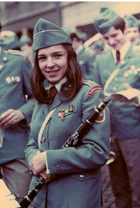
Klarinetistka chebského orchestru / Klarinetistin des Egerer Orchesters, FIJO 1974