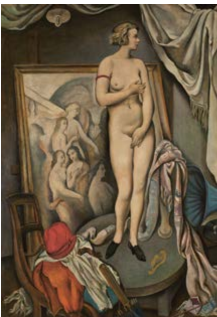
Model v pose Venuše / Modell in der Pose der Venus, 1924, olej na plátně / Öl auf Lnw., 156 x 122 cm, rodinná sbírka / Familiensammlung

GAVU – Opus magnum 10. 9. 2020–17. 1. 2021 Kurátor / Kurator David Chaloupka Vernisáž ve středu 9. září v 17.00. 9. prosince v 17.00 přednáška D. Chaloupky o autorovi.