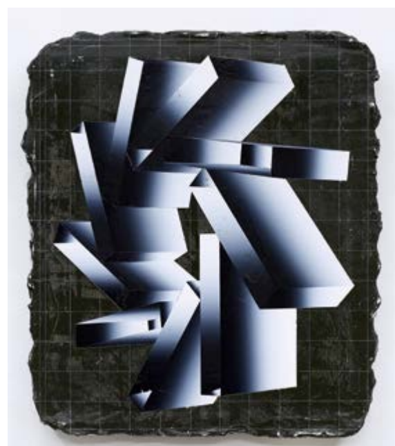
Bez názvu / O. T., 2018, olej a akryl na plátně / Öl und Acryl auf Lnw., 60 x 50 cm

GAVU – Malá galerie / Kleine Galerie 10. 1.–31. 3. 2019 Kurátor / Kurator Marcel Fišer Vernisáž ve středu 9. ledna v 17.00.