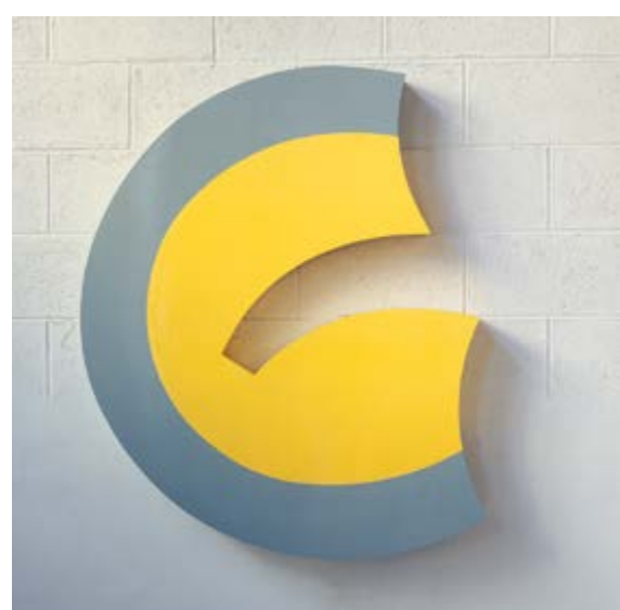
R 7/1997, lakovaná překližka / lackiertes Sperrholz, 121,5 x 98 x 14 cm

GAVU – Velká galerie / Grosse Galerie 10. 1.–24. 3. 2019 Kurátor / Kurator Tomáš Winter Vernisáž ve středu 9. ledna v 17.00.