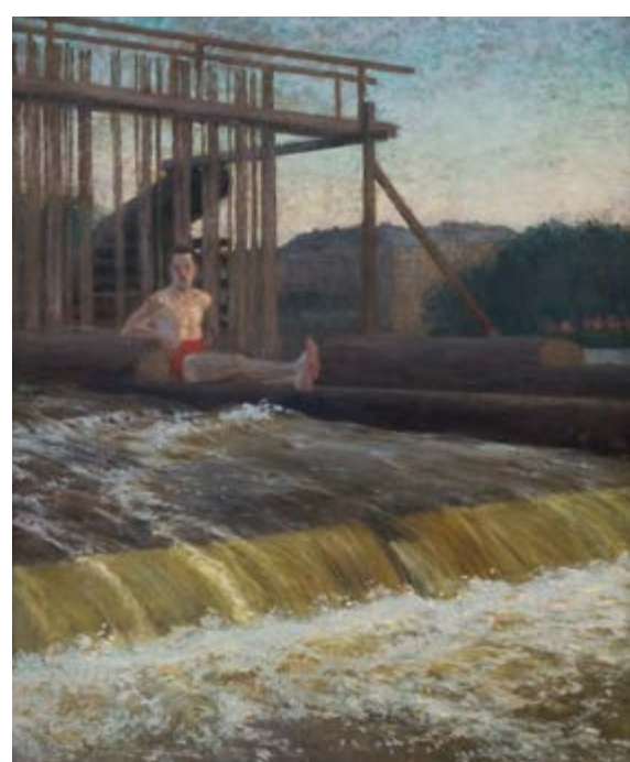
Miloš Jiránek, Na jezu (Jez u Palackého mostu) / Am Wehr (Das Wehr bei der Palacký Brücke), 1905–1906, olej, plátno / Öl, Lnw., 173 x 143 cm, GAVU Cheb

GAVU – Opus magnum 10. 1.–31. 3. 2019 Kurátor / Kurator Tomáš Winter Vernisáž ve středu 9. ledna v 17.00.