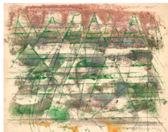
Zdeněk Sklenář, Čínské hory / Chinesische Berge, 1957, akvarel na papíru / Aquarel auf Papier, 24,5 x 30 cm, GAVU Cheb

GAVU – Výstava z depozitáře / Ausstellung aus dem Depot 7. 11. 2018–3. 3. 2019 13. února, 17.00, Staré písně, prastaré, pořad Ivo Hucla (autorské čtení) a Ondřeje Smeykala (didgeridoo)