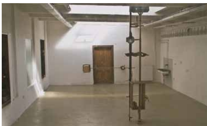
Oldřich Morys (FaVU VUT Brno), 2011, pohled do instalace

Galerie výtvarného umění v Chebu 19. 1.–25. 3. 2012 Vernisáž 18. 1. 2012, 17.00