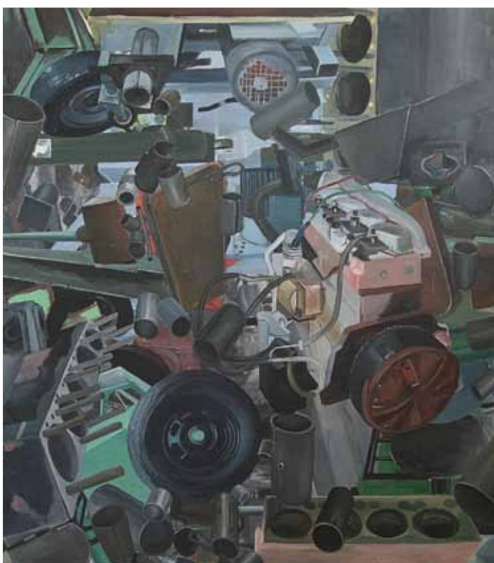
Radim Langer (VŠUP Praha), Bez názvu , olej na plátně, 230×210 cm

Fascinace architekturou v její utopické fantaskní podobě je jedním z témat, které se objevují jak u starých mistrů, tak i v moderním umění. A samozřejmě nejvíce ve filmu s jeho neomezenými možnostmi simulace, kde utopická sídla nabývají nejrozmanitějších podob, od gotických katedrál po obytné kosmické lodě. Nejčastěji se oba principy – futuristický a historizující – prolínají, podobně jako ve fascinující instalaci Leferise Kiourtsogloua (1981, ASFA Atény).