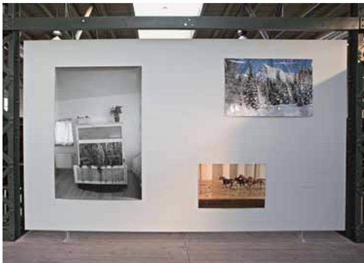
Lucie Sceranková (AVU Praha), pohled do instalace na výstavě StartPoint 2011 ve Wannieck Gallery v Brně