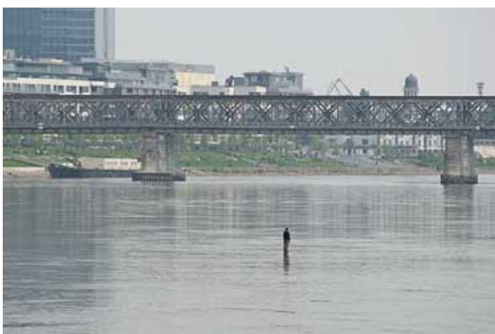
Tomáš Šoltys (VŠVU Bratislava), Člověk na řece , 2011, performance, tisk, 2,7×4 m

Ačkoliv Lucie Sceranková (1985, AVU Praha) vypadá na první pohled jako fotografka, je spíše inscenátorkou a kouzelnicí, připravující drobné iluze a surrealistické přeludy, využívající metody trikového filmu i subverzivní reklamy. Výsledná instalace několika fotografií vytváří jakýsi katalog grafických snů, kde se zdánlivě reálné věci ukazují jako pouhé klamavé obrazy, které rozvětvují skutečnost do mnoha rovin.