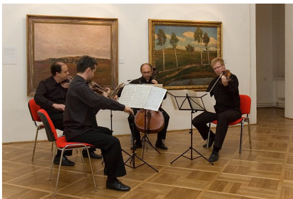
Komorní koncerty u příležitosti otevření výstav Josefa Čapka a Antonína Slavíčka