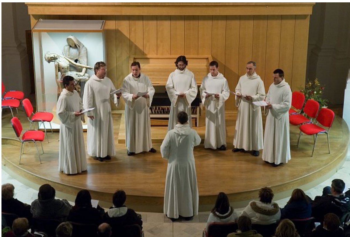
Kostel sv. Kláry - Schola Gregoriana Pragensis