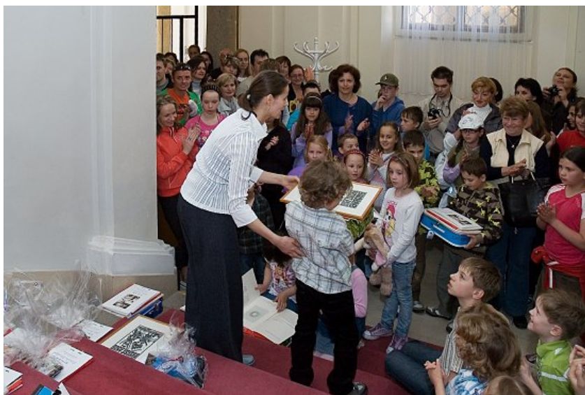
Vyhlášení a předání cen soutěžícím jednotlivých vítězných kategorií v soutěži „Jede, jede poštovský panáček“

Galerie výtvarného umění v Chebu vyhlásila výtvarnou soutěž pro žáky ZŠ a nižšího gymnázia (do 15-ti let) s názvem „Jede, jede poštovský panáček“. Zadání soutěže bylo na témata pošta, její druhy, možnosti a poslání, návrhy poštovních známek (s různorodou tematikou), obálek, razítek či poštovních schránek, návrh na poštáckou uniformu či logo České pošty. Soutěžními obory byly kresba, malba, grafika, koláž, assembláž, fotomontáž, batika, patchwork, vyšívání a keramika. Termín vyhlášení soutěže 8. února 2010 a uzávěrka 4. května 2010. Vítězné práce byly vybrány ve třech věkových kategoriích (7 – 9 let, 10 – 12 let, 13 – 15 let) a slavnostní vyhlášení výsledků a předání cen proběhlo při příležitosti otevření výstavy Dětské kresby v prostorách Kabinetu kresby a grafiky dne 27. května 2010.