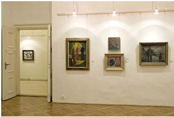
Pohled do expozice výstavy Josef Čapek / Země a lidé