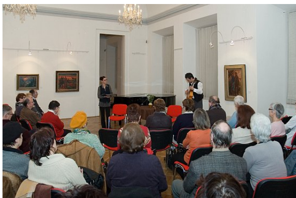
Podvečerní čtení z vybraných próz Josefa Čapka