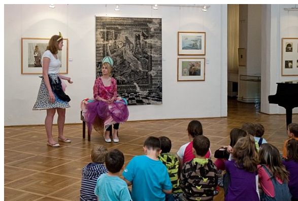
Dramatický kroužek ZUŠ v Chebu uvedl satiru I. A. Krylova s názvem „Trumf“