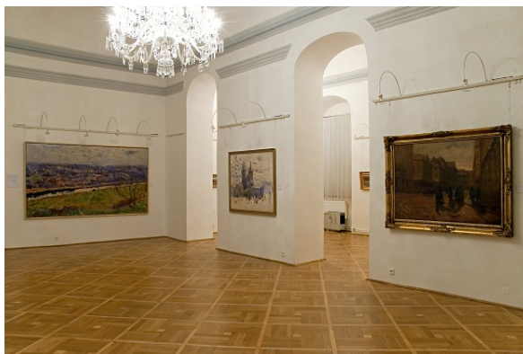
Pohled do expozice výstavy Antonín Slavíček 1870 – 1910