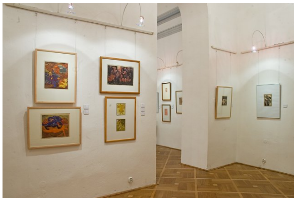
Pohled do expozice výstavy on – lino / český linoryt 1910 – 2010