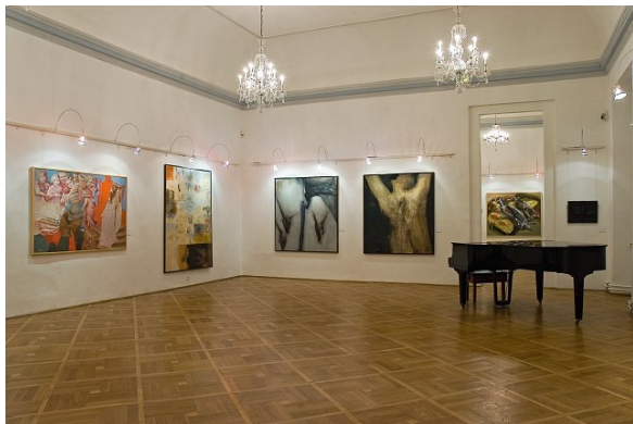
Pohled do expozice výstavy Obrazy z depozitářů