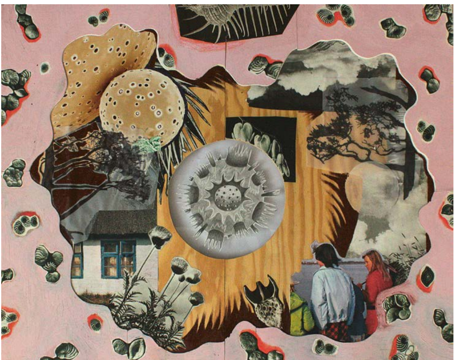
Bojiš se?, 2023, kombinovaná technika na plexiskle, 80 × 100 cm