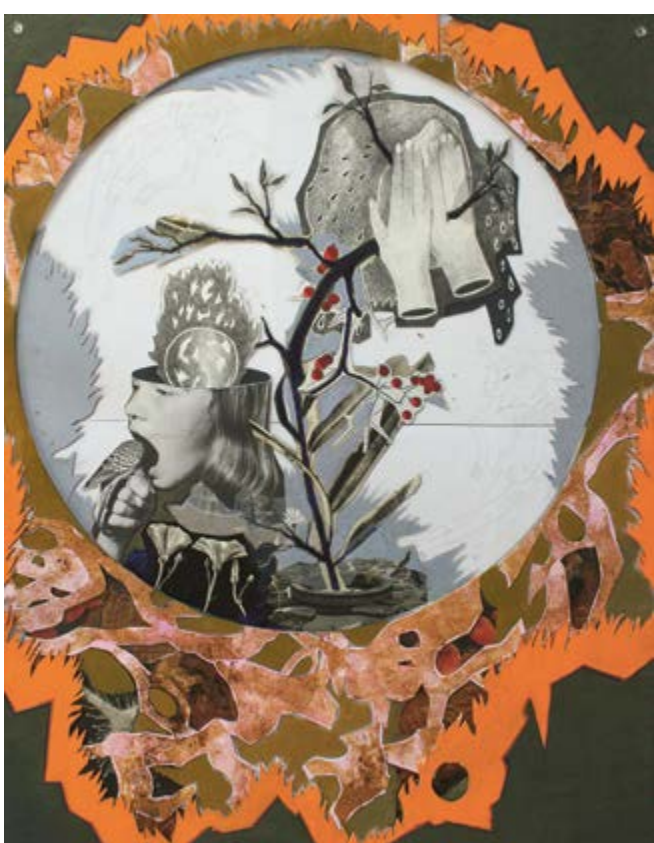
Ztracená vzpomínka, 2024, kombinovaná technika na plexiskle, 78 × 60 cm