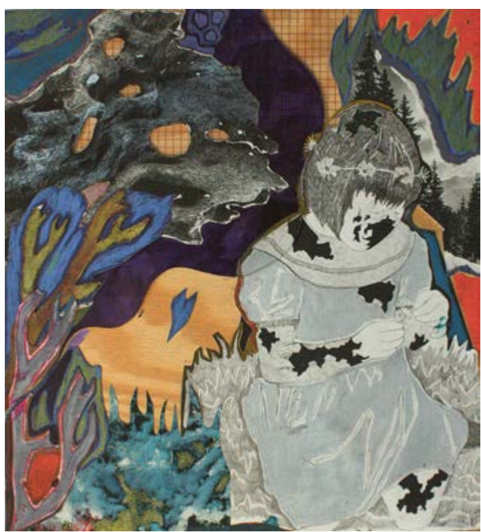
Dřevěná sukně, 2024, kombinovaná technika na plexiskle, 230 × 165 cm Slunovrat, 2024, kombinovaná technika na plexiskle, 102 × 67 cm Pamatuješ si to?, 2024, kombinovaná technika na plexiskle, 63 × 38 cm Na louce, 2024, kombinovaná technika na dřevěné destičce, 35 × 32 cm